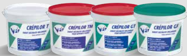
CRÉPILOR T-TM-GT-GF ©VPI Enduits décoratifs organiques / Fiche technique disponible sur www.vpi.vicat.fr