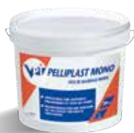
PELLIPLAST MONO ©VPI Ragréage mural en pâte Fiche technique pages 38/39