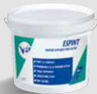
ESPINT ©VPI Peinture de façade acrylique Fiche technique disponible sur www.vpi.vicat.fr